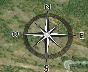
FOTO AÉREA EN PERSPECTIVA