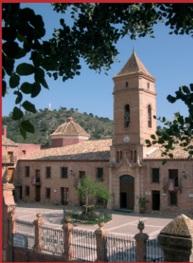
Entorno de "LA SANTA"